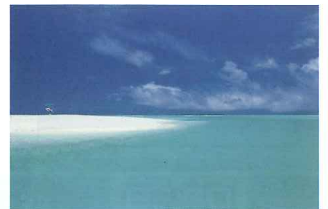
ハテの浜を横から見るコース

久米島生まれ久米島育ち。遊漁や、ダイビング・シュノーケルツアーなども行っており、久米島の海を知り尽くした海人。 「色んな角度から見る、まだ知られていない久米島の景色を、ぜひ楽しんで下さい」