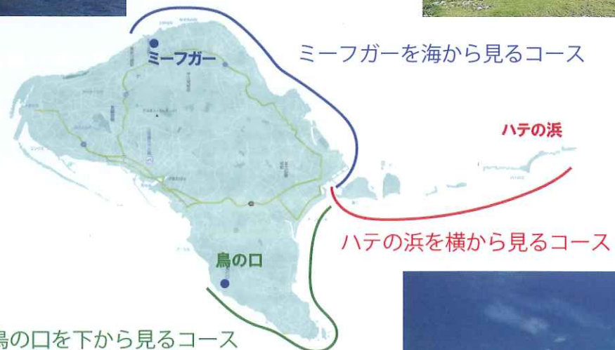
鳥の口を下から見るコース